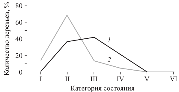
Рис. 3. Распределение деревьев тополей лавролистного (1) и черного (2) по категориям состояния в лесополосе рядового способа посадки с широким междурядьем (пп 3).

приходится 57 % деревьев. У этой же древесной породы в ПЗЛП рядового способа посадки с широким междурядьем (пп 4) жизненное состояние деревьев хуже, только 20 % из них не имеют признаков ослабления, а остальные отнесены к усыхающим и к свежесухшим (рис. 2).