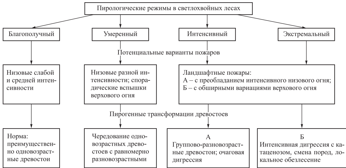
Рис. 1. Схема пирогенной динамики таежных светлохвойных лесов в бассейне Байкала.

ности воздуха. Огонь ослабевает к концу дня, а ночью едва тлеет. Отсюда следует неравномерность воздействия долговременных ландшафтных пожаров на лесные массивы. С другой стороны, отмеченные вариации используются лесной охраной при выборе тактических решений для остановки и локализации пожаров.